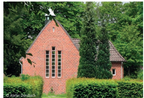
9100-0138 Veranstaltungsraum, ehem. Friedhofskapelle Instandsetzungen mit Restaurierungsarbeiten