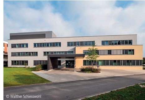
3200-0024 Notfall- u. Diagnostikzentrum, Eingangshalle Ohne Gebäudeartenzuordnung ☞ Reichardt + Partner Architekten Hamburg