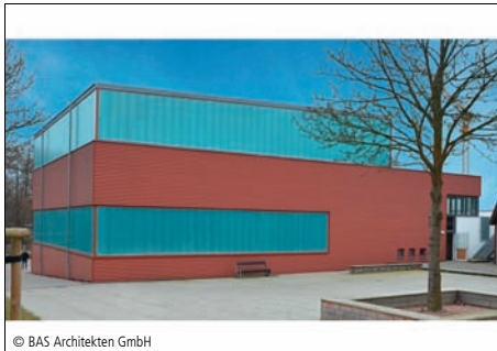
4200-0033 Ausbildungsstätte Abbundhalle Erweiterungen; Schulen ☞ BAS Architekten GmbH Bad Segeberg