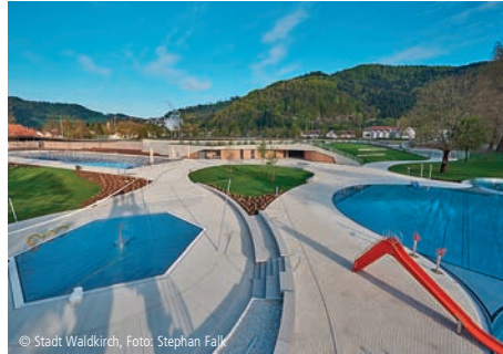
5200-0013 Freibad Ohne Gebäudeartenzuordnung Kaufmann Theilig & Partner Freie Architekten BDA Ostfildern