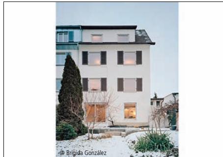
6100-1329 Reihenendhaus Modernisierungen; Ein- und Zweifamilienhäuser vor 1945 AMUNT Nagel Theissen Architekten und Designer PartG mbB, Stuttgart