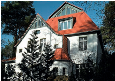
6100-1286 Mehrfamilienhaus, Dachgeschoss Erweiterungen; Wohngebäude: Dachausbau rundzwei Architekten Berlin