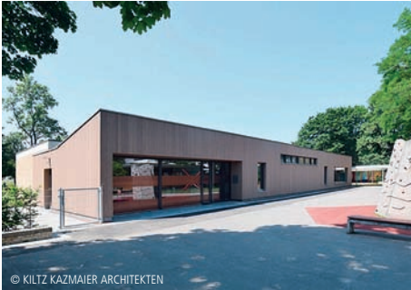
4400-0295 Kindertagesstätte, Nebenräume (40 Kinder) Erweiterungen; Kindergärten KILTZ KAZMAIER ARCHITEKTEN Kirchheim unter Teck