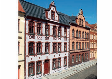
6400-0092 Familienzentrum Umbauten; Gebäude anderer Art ☐ °pha Architekten BDA Banniza, Hermann, Öchsner PartGmbH, Potsdam