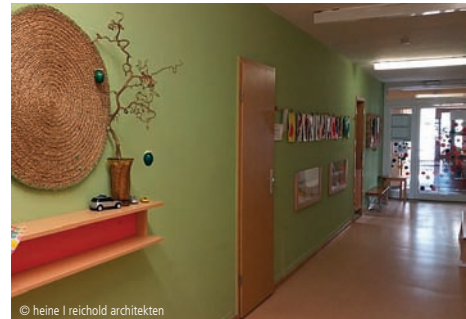
4400-0276 Kindertagesstätte, Entwässerungsarbeiten Instandsetzungen; Nichtwohngebäude ☞ heine | reichold architekten Partnerschafts- gesellschaft mbB, Lichtenstein