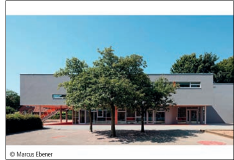
4100-0184 Grundschule (9 Klassen, 173 Schüler), Hort Erweiterungen; Schulen ☞ acollage architektur urbanistik Hamburg