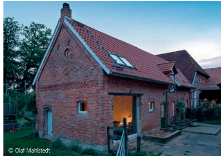
6100-1293 Einfamilienhaus Umbauten; Ein- und Zweifamilienhäuser .rott .schirmer .partner Großburgwedel