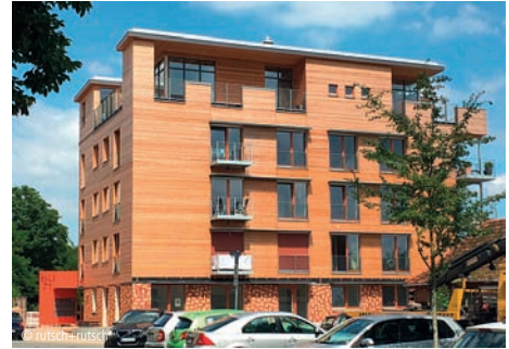
6100-1372 Mehrfamilienhaus (12 WE) - Effizienzhaus 70 Umbauten; Mehrfamilienhäuser ☐ rutsch+rutsch architektur+szenografie Schwerin