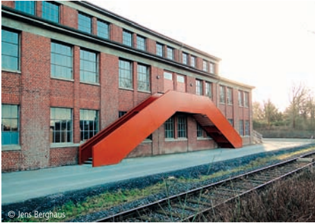
9100-0154 Fluchttreppe Erweiterungen; Gebäude anderer Art BERGHAUS ARCHITEKTEN Düsseldorf